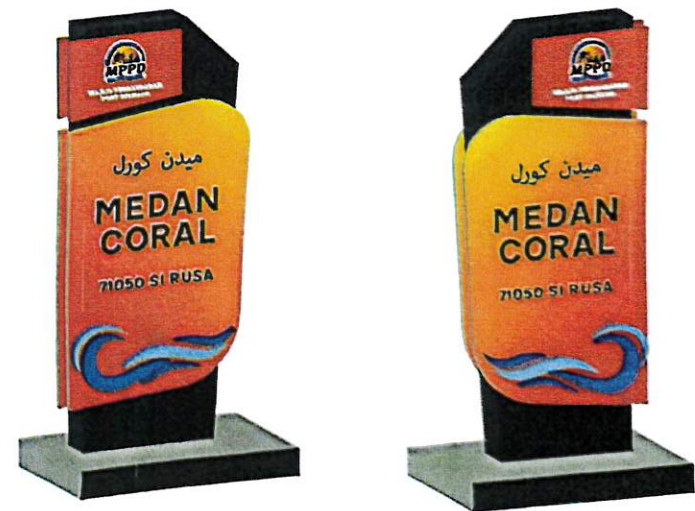
PANDANGAN 3 DIMENSI MERCU TANDA

Tiang utama keluli M/S SHS 50mm x 50mm ditanam pada kedalaman 600mm.